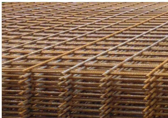
síť 8/8 100/100 3000/2000 hladká

Pozinkované hladké síť pr. 5mm jsou vhodné na výrobu gabionových prvků, na okrasné zahradní pergoly, lavice či stání na popelnice, kola a auta. Díky žárově pozinkovanému povrchu nekorodují.